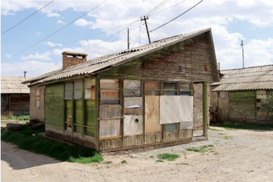
Նկ. 3. «Ֆիննական տնակներից» մեկը (հասցե՝ Երվանդ Լալայան փողոց: Ներկայումս փողոցը անվանակոչված է ազատամարտիկ Վանիկ Ալիխանյանի անունով):