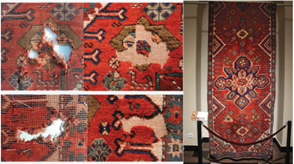
Նկ. 6. Գորգ, գ. Գլաձոր, Եղեգնաձորի փարաժաշրջան, 20-րդ դարի սկիզբ, բորոյ: ՀՊԹ Ա 9263: