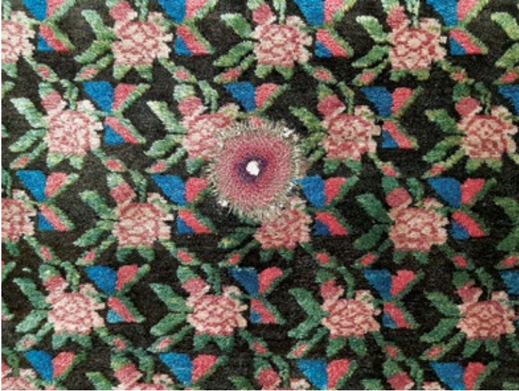
Նկ. 1. Գորգ, 20-րդ դարի սկիզբ, Լոռի, քուրդ: ՀԱԹ 3705:

Գորգի վերականգնման սկզբունքները. Միջազգային չափորոշիչներ, հայաստանյան փորձ