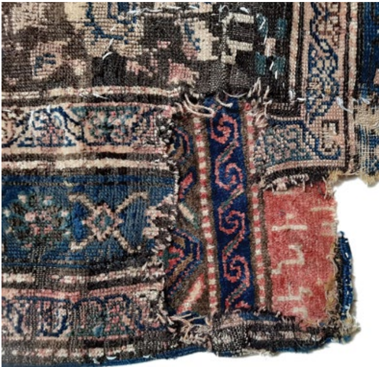
Նկ. 2. գորգ, 1914 թ., Գուգարք, քուրդ: ՀԱԹ 3839: